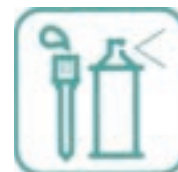
déchets ménagers spéciaux

Un gardien vous oriente et enregistre votre passage