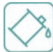
huiles de vidange